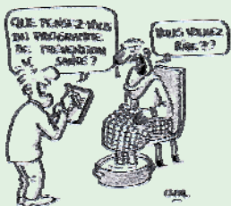
Dessin extrait du petit guide de l'évaluation en promotion de la santé de Francis Nock

Une formation sur le thème de l'évaluation en promotion de la santé.